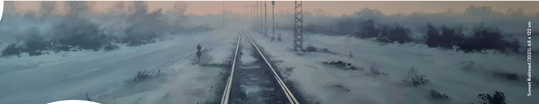
Sunset Railroad (2023). 68 x 122 cm