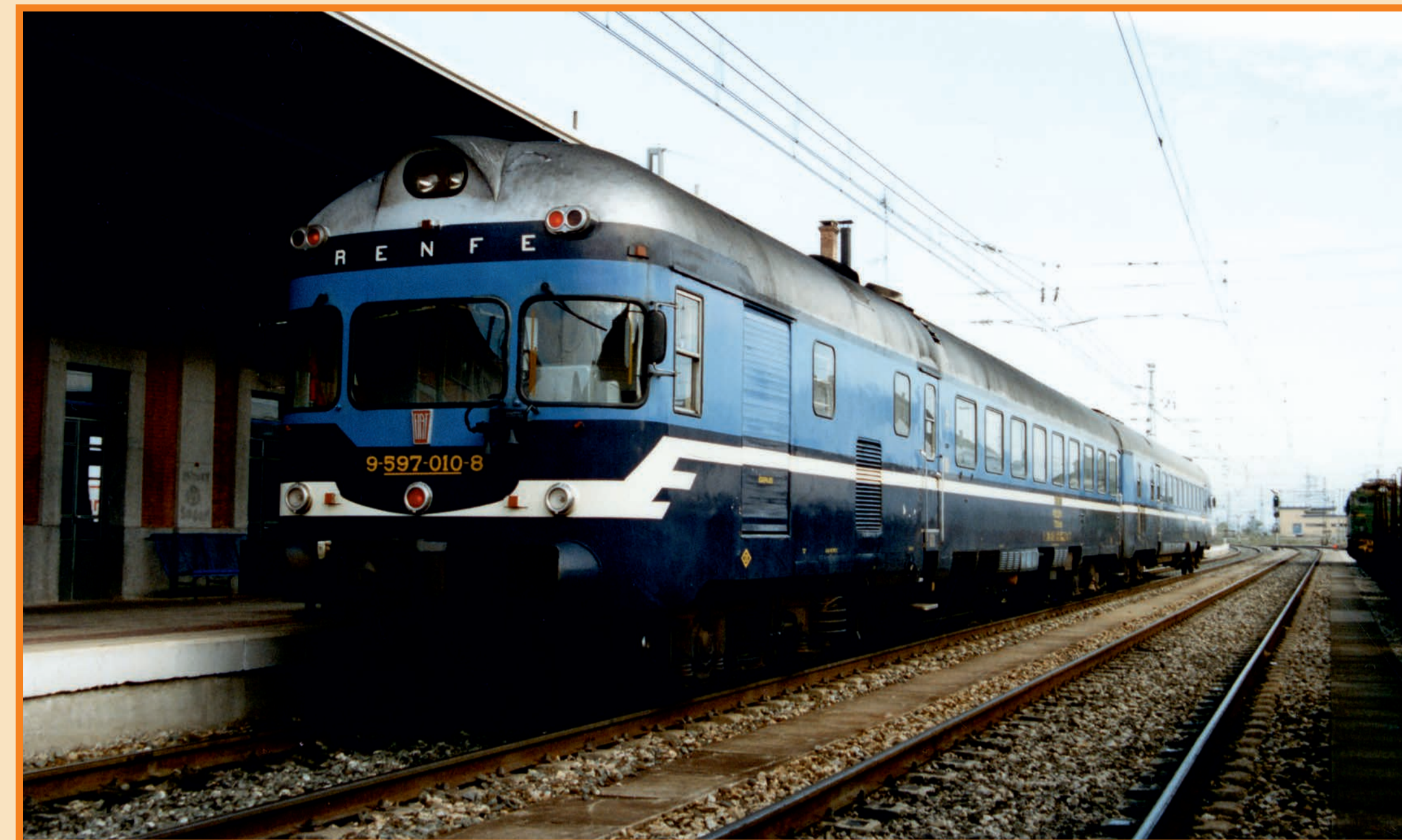
Exhibit IG 1432

The 597-010-8 was withdrawn from service in 1994 and was side-lined in the depot of Cerro Negro, Madrid, until it was donated to the "Asociación Vallisoletana de Amigos del Ferrocarril" (Valladolid Association of Friends of the Railway). In 2013, it was restored and set in motion after being donated to the Sierra Norte de Madrid Local Action Group (Galsinma). It has been exhibited in the Madrid Railway Museum's central hall since 2015.