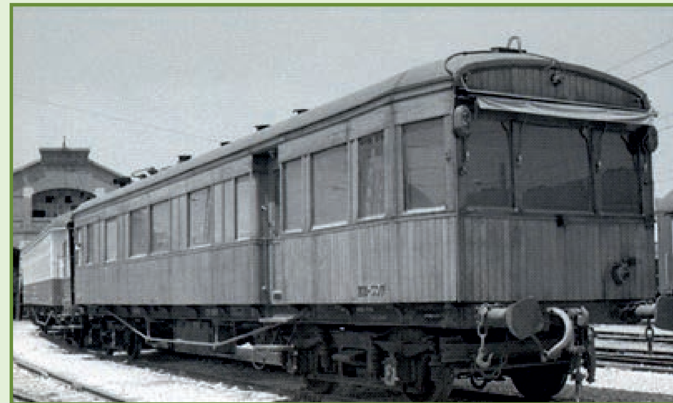
Exhibit IG 170

In 1987, it was removed from RENFE’s rolling stock and taken to the Museum, where it was restored and has been on display since then.