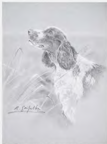
“Springer Spaniel”, obra de Rafael Grijalba.

Una decena de artistas han integrado la programación de 1999. Los óleos de Juan del Pozo estarán expuestos hasta el 7 de noviembre; del 11 de noviembre al 5 de diciembre podremos contemplar las obras de Rafael Grijalba y la temporada finaliza con las pinturas de Antonio Monrocle.