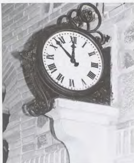
Reproducción del reloj de la estación de Toledo. Precio 14.500 Ptas.