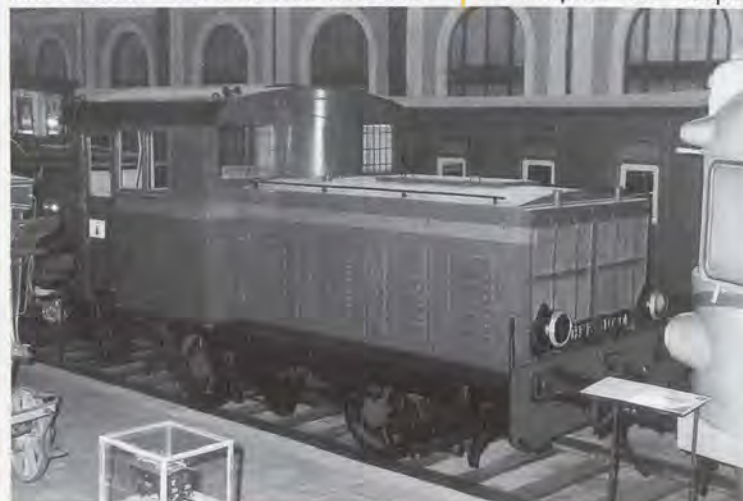
Vista lateral del tractor 10.201 que se exhibe en el Museo.

Estas experiencias, realizadas a título de ensayo, no dieron resultados positivos, debido fundamentalmente al empleo de máquinas de vapor,