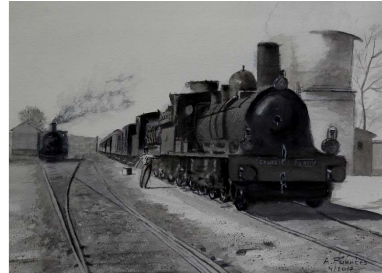
"Tren en grises I", 28 x 39 cm, 2017

"Los colores en la pintura están para persuadir a los ojos" Nicolas Poussin